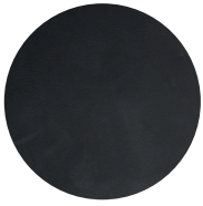
Sadie Dark Grey